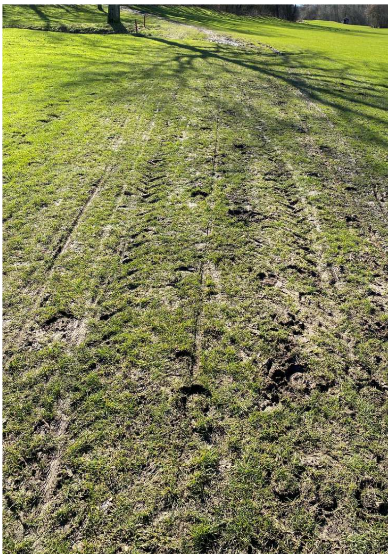
Pferde- und Traktorspuren auf dem Weg, der die Bahn 5 kreuzt.